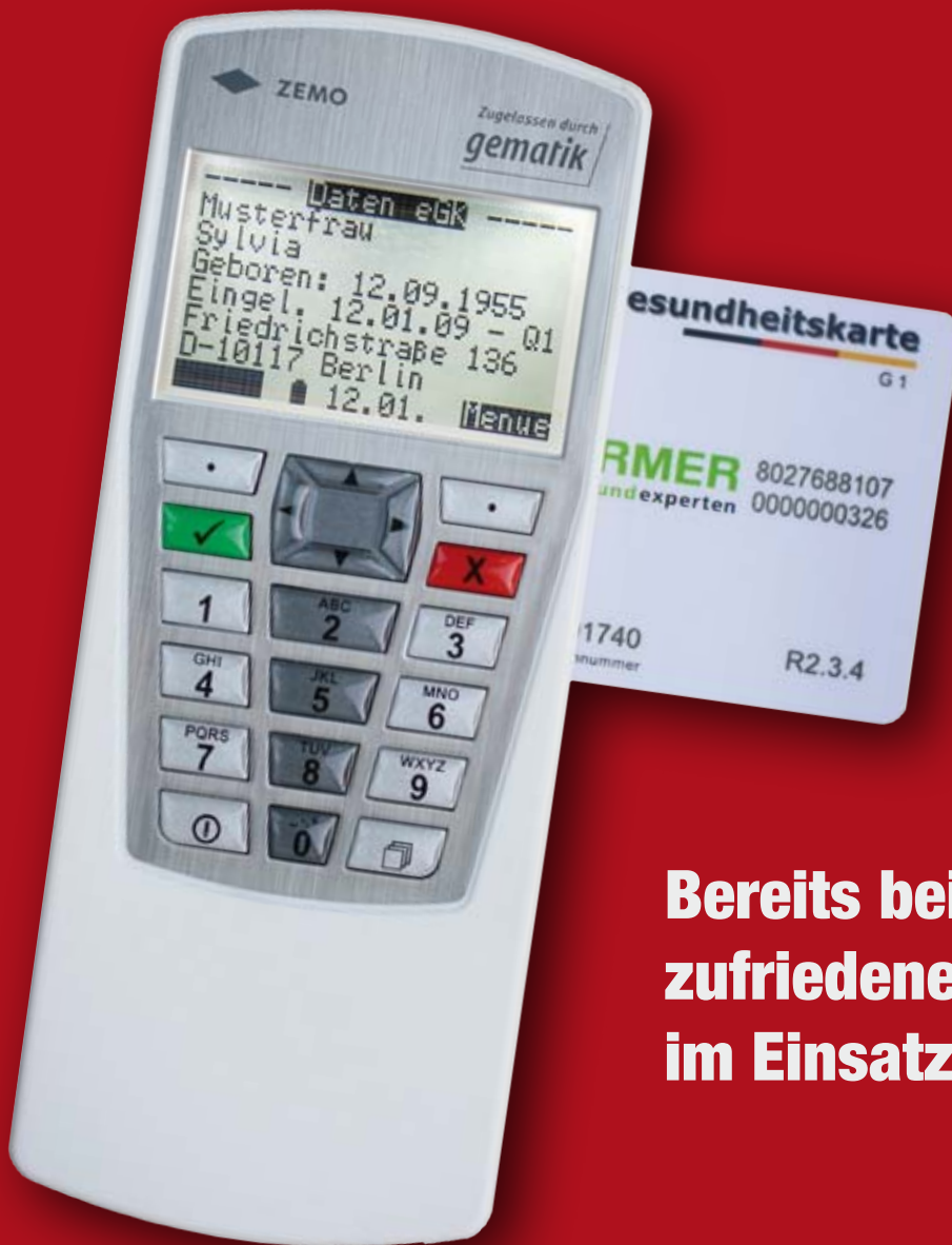
Abbildung: Maßstabsgetreu Farbe: Weiß mit Inlay in gebürsteter Edelstahloptik